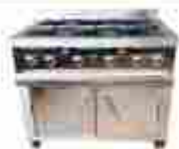
Estufas a gas