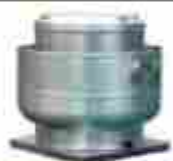
Extractor tipo hongo