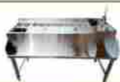
Estación de coctel