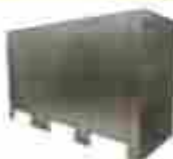
Divisiones de baño