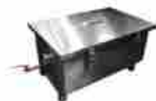
Trampas para grasa