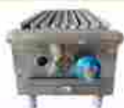
Parrillas a gas