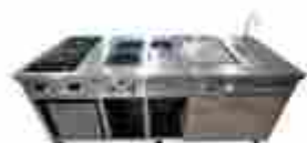
Módulos de Cocción