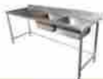
Mesa de lavado